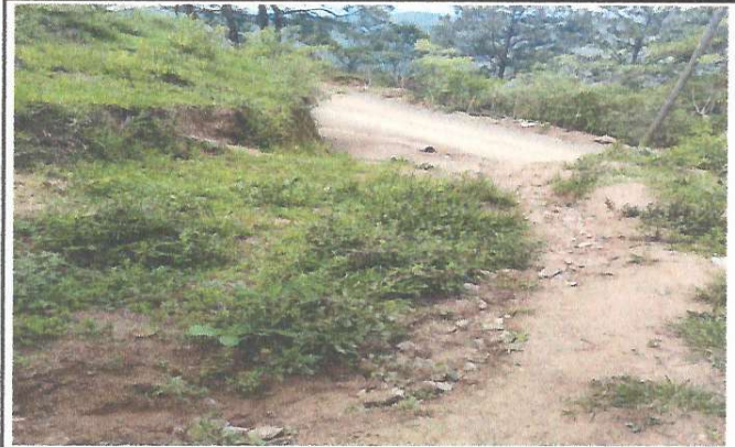
Foto 2: Losa de patio no se encuentra en buenas condiciones para el acceso al Centro Educativo y tampoco para el area recreativa de los estudiantes.