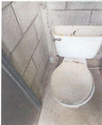
Foto 3: Los sanitarios del Centro Educativo se encuentran en malas condiciones.