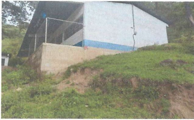
Foto 1: fachada de escuela e ingreso, el muro perimetral ya no se encuentra en buenas condiciones y es peligroso por el ingreso de personas ajenas al Centro Educativo.